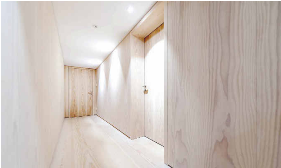
Funktionstüren mit Brand- und Schallschutzfunktionen zwischen Verkleidungen in Douglasie