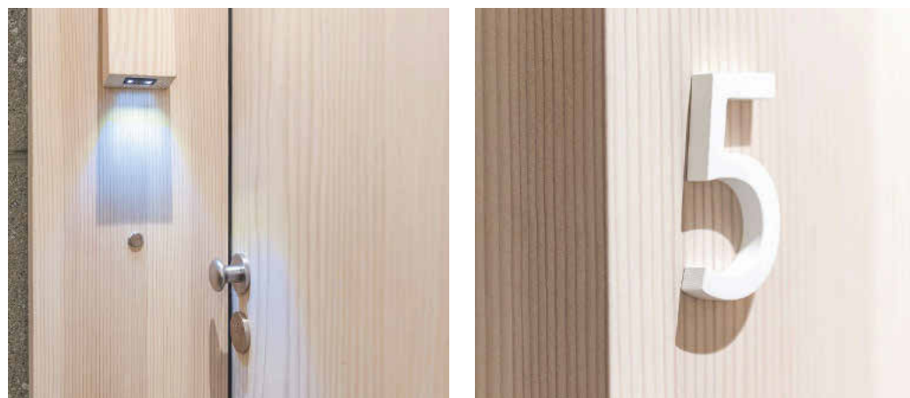
Wohnungseingangelemente mit 74 mm starken Blockzargen und feinen Details

milde Lauge und weiße, wachshaltige Seife dem Holz ein schönes, helles Aussehen, einen nordischen Ausdruck verleihen. Mit sauber gesetzten Fugenbildern und flächenbündigem Übergang von Blockzargenprofil zu den Wandverkleidungen. Türhöhen von bis zu 270 cm geben den Wohnungseingangelementen eine Großzügigkeit schon vor dem Eintritt in die unterschiedlich geschnittenen Apartments. Die Montage der furnierten Wandverkleidungen erfolgte klassisch auf Keilleisten, abgestimmt auf die Fugenausbildungen. Sauber integriert sind die Nischen für Feuerlöscher und die Revisionsöffnungen für die Haustechnik.