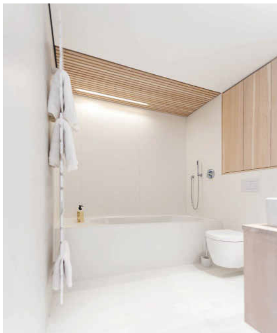
Warmtonige Douglasie als Kontrast zum vielen Weiß