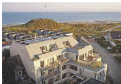
Das Inselhouse auf Norderney aus der Möwenperspektive

Beim »Inselhouse« auf Norderney haben die Macher viel Wert auf eine einladende Erschließung des Appartementbaus mit 21 Einheiten gelegt. Die Arbeiten mit über 100 Türelementen und das weitere Tischlerwerk in Douglasie waren bei der Tischlerei Wigger in guten Händen.