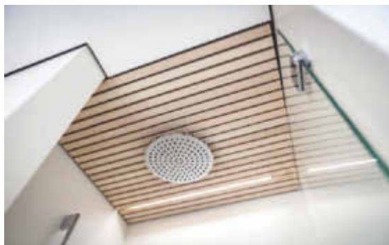
Massive Douglasie über Duschen und Wannen