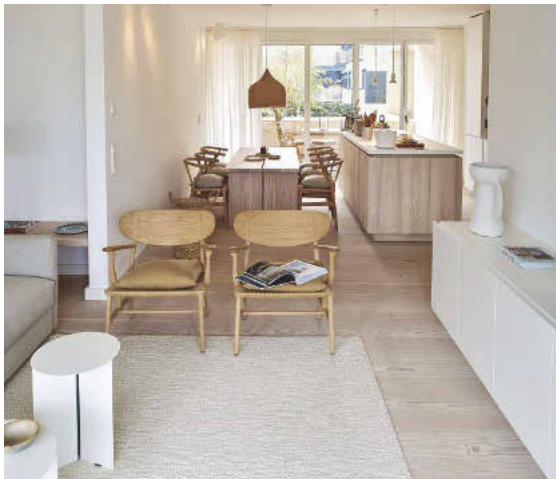
Apartmentgrößen von 52 bis 111 m 2 warten auf Gäste