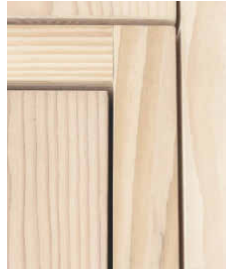
Klarer, flächenbündiger Zargenaufbau