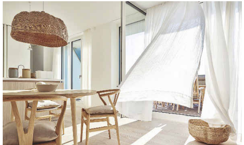
Die frische Nordseebrise der Insel umweht die Apartments und die Terrassen

bei dem Norderney-Projekt. Ob besondere Oberflächenausführungen wie der geseiften Douglasie oder besonders großformatige, individuelle Türblätter mit kombinierten Anforderungen.